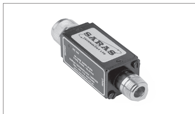
Рис. 4. Усилитель для включения в линию сигнала (модель SLA002-8-10)

Помимо усилителей мощности, компания выпускает усилители, предназначенные для компенсации потерь в кабелях, используемых в радиосистемах. Эти решения предназначены для различных частот в диапазоне UHF, в том числе изготавливаются и широкополосные модели. Они включаются в линию прохождения высокочастотного сигнала, и питание осуществляет-