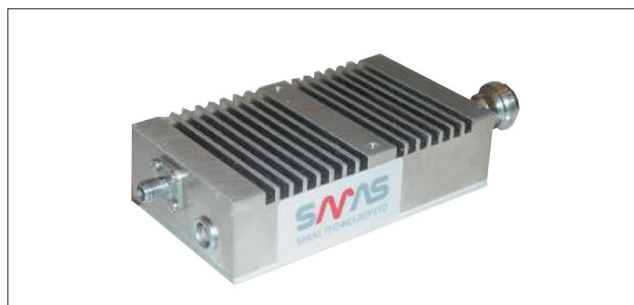
▲ Рис. 2. Компактный усилитель мощностью 1 Вт (модель SPA001)